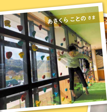
あさくらことの さま