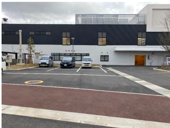
搬入口1 ※公園側からの写真